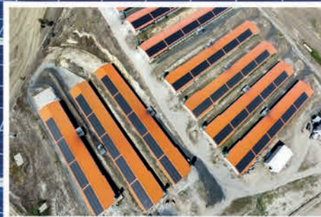
Asofis Karalar Çatı GES