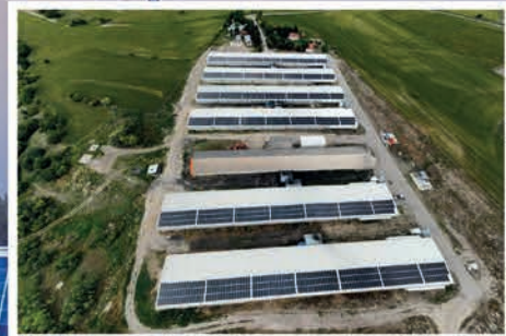
Asofis Pazarköy Çatı GES