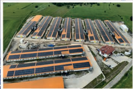
Asofis Karabük Çatı GES

Being aware of its responsibility for environmental values, Aspiliç has succeeded in reducing its carbon footprint with renewable energy sources. Aspiliç continues to take important steps to leave a better world to future generations by using 100% renewable energy with a total installed power capacity of 34.23 Megawatts.