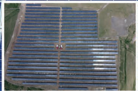
Asofis Dereköy Arazi GES